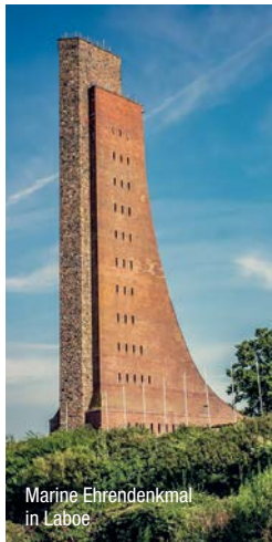
Marine Ehrendenkmal in Laboe

Wie umgehen mit Erinnerungsorten, Denkmäler und Plaketten, wenn sich die politische Lesart durch neueste Forschung ändert? Was vor kurzem noch als identitätsstiftend galt, kann durch neue Betrachtungsweisen kritisch bewertet werden. An der Ostseeküste von Laboe bis Flensburg finden wir bei genauerem Hinsehen dutzende historische Erinnerungsorte, insbesondere aus den beiden Weltkriegen, die eine gemeinsame Betrachtung wert sind