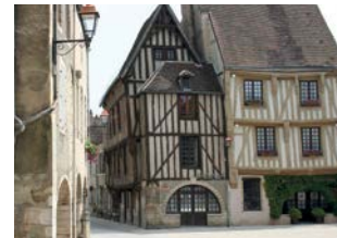
Altstadt von Troyes

Champagne! Natürlich denkt man hier zunächst an Weinberge und weltberühmte Kellereien. Aber die Champagne hat noch viel mehr zu bieten: so sind Reims und seine Kathedrale das Herzstück des französischen Königtums, denn