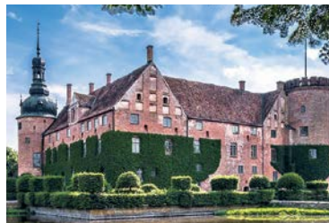
Vittskövle Castle in Skåne

Die südschwedische Provinz Schonen (Skåne) besitzt die größte Dichte an Schlössern und Herrenhäusern im Lande. Ein erheblicher Teil von ihnen entstand bereits im Mittelalter