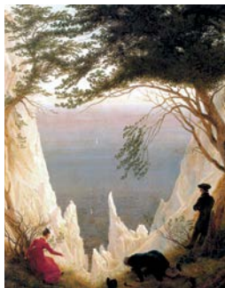
Der Kreidefelsen auf Rügen von Caspar David Friedrich

2024 feiert die Kunstwelt den 250. Geburtstag von Caspar David Friedrich, der in Greifswald geboren wurde. Seine ikonischen Bildwerke gehören zu den Meisterwerken der Romantik. Bis heute geht von ihnen ein geheimnisvoller Zauber aus, dem man sich kaum entziehen kann. Die Kompositionen seiner Werke wurden von den Landschaften beeinflusst, die er sich im Laufe seines Lebens erarbeitete. Dabei nimmt die Insel Rügen eine herausragende Rolle ein. Auf der größten deutschen Insel sind wir auf seinen Spuren unterwegs und besuchen die Ausstellung „Sehnsuchtsorte“ im Pommerschen Landesmuseum Greifswald.