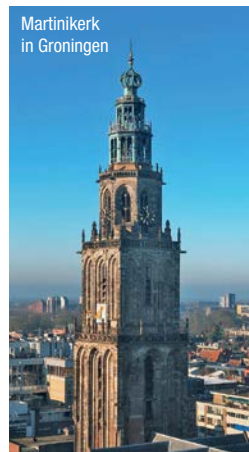
Martinikerk in Groningen

Die beiden niederländischen Provinzen Groningen und Drenthe sind voller verborgener Orgelschätze, so findet sich kaum eine Kirche ohne ein Instrument von berühmten Orgelbauern wie Arp Schnitger und seinen Nachfolgern. Durch die fachkundige Begleitung eines Organisten wird uns dieser Orgelschatz erschlossen. Daneben ist die im Norden der Niederlande gelegene Region reich an eindrucksvollen Adelssitzen, ehemaligen Klöstern wie Ter Apel und malerischen Dörfern. Lassen Sie sich von den vielfältigen Kulturschätzen unseres westlichen Nachbarlandes überraschen!