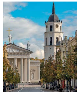
Kathedrale mit dem Glockenturm in Wilna

„Gut ist es, lange und schweigend über dem heiligen Memelstrom zu sitzen“, notierte Ernst Wiechert über dieses schöne, fast vergessene Land am Strom mit der Kurischen Nehrung und der früheren Künstlerkolonie Nidden. Unsere Reise mit vielen Begegnungen vor Ort führt von Memel/Klaipėda über die Kurische Nehrung und die Burg Trakai bis nach Wilna/Vilnius mit seinen bedeutenden architektonischen und religiösen Zeugnissen.