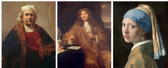
Rembrandt van Rijn