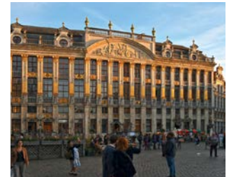
Grand Place in Brüssel

Eine Veranstaltung der Europäischen Akademie Schleswig-Holstein