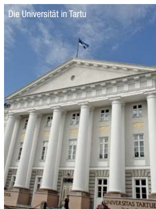
Die Universität in Tartu

Estland – das Land der mittelalterlichen Burgen und Städte, der deutschbaltischen Güter, der technologischen Prosperität von e-Estonia, aber auch mit beinahe einem Drittel russischstämmiger Bevölkerung, lockt mit unverwechselbarer Natur und wechselvoller Geschichte. Wir besuchen die Insel Dagö/Hiiumaa, die 1632 von König Gustav II. Adolph gegründete Universität in der Kulturhauptstadt des Jahres 2024, Dorpat/Tartu, sowie die Siedlungen der orthodoxen Altgläubigen am Peipussee.