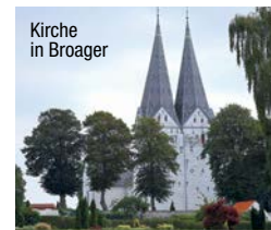
Kirche in Broager

Eine Veranstaltung der Europäischen Akademie Schleswig-Holstein