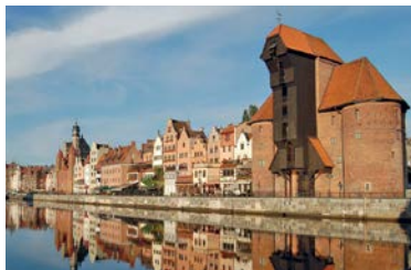
Krantor in Danzig

Die alte, wiedererstandene Hansestadt Danzig zählt zu den beliebtesten Reisezielen Europas. Unsere Hin-fahrt führt über das wunder-bar erhaltene Thorn/Toruń im Kulmer Land an der Weichsel, zurück geht es über die Messestadt