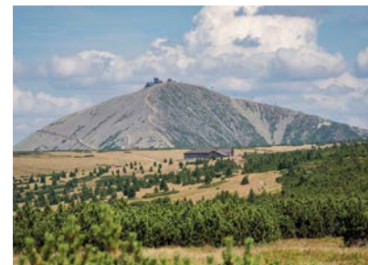
Gipfel der Schneekoppe

Überreich an Baudenkmalern, Kulturschätzen und landschaftlicher Schönheit wird das Hirschberger Tal oft als Schlesiens Elysium bezeichnet. Die prächtigen Residenzen und idyllisch anmutenden Altstädte werden überragt vom eindrucksvollen Kamm des Riesengebirges,