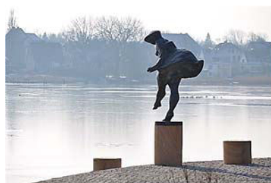
Carl Constantin Weber, Badende (Schleswigerin), 2008, Bronze Schleipromenade Schleswig