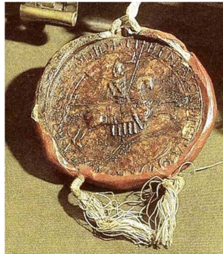
Reitersiegel Heinrichs des Löwen von 1160