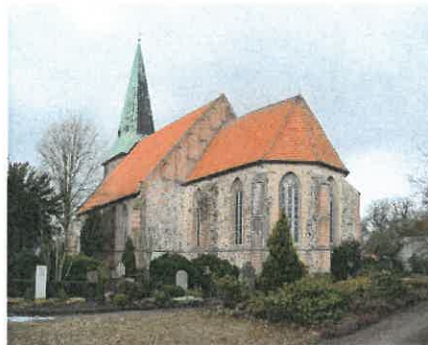
St. Cyprrianus und Cornelius-Kirche