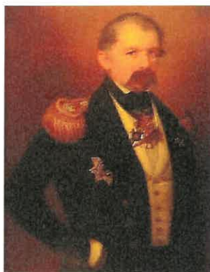
Admiral Karl Rudolf Brommy

Das Abendessen nehmen wir heute und in den nächsten Tagen im für seine ausgezeichneten Weine berühmten historischen Ratskeller ein. Übernachtung im zentral und nahe der Weser gelegenen Design-Hotel Motel One.