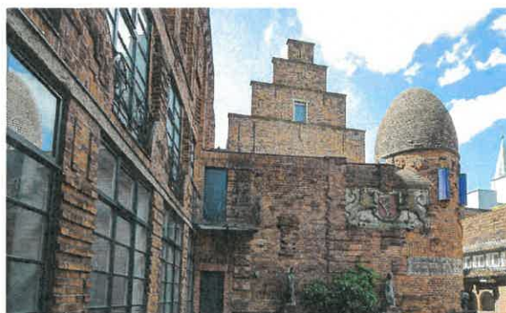
Paula-Modersohn-Becker-Museum in Bremen

Ca. 19.00 Uhr Ankunft im Akademiezentrum Sankelmark