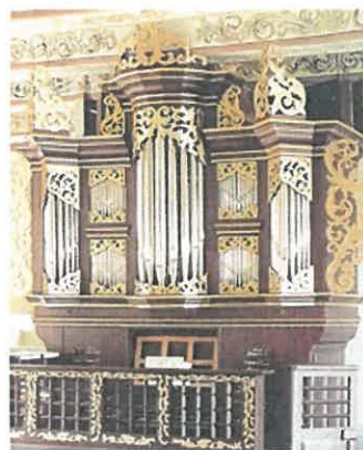
Arp-Schnitger-Organ in Dedesdorf