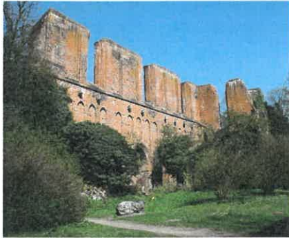
Klosterruine von Hude