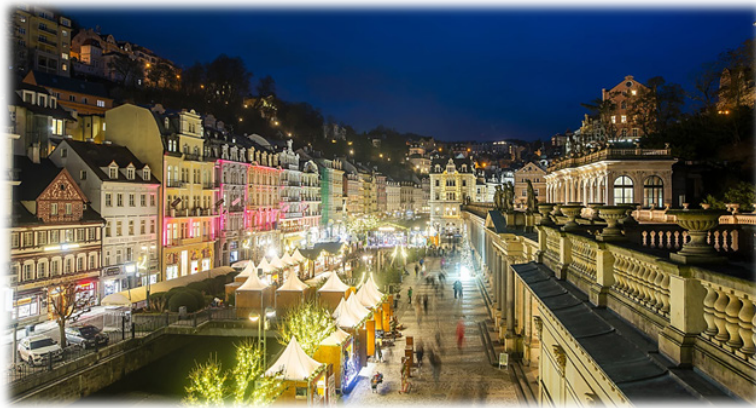
Weihnachtsmarkt in Karlsbad/Karlovy Vary