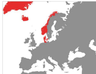
Dänischer Gesamtstaat Ende des 18. Jahrhunderts (ohne tropische Kolonien)