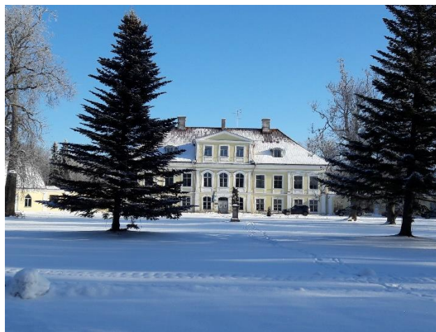
Gutshaus Saue, Friedrichshof , in Estland