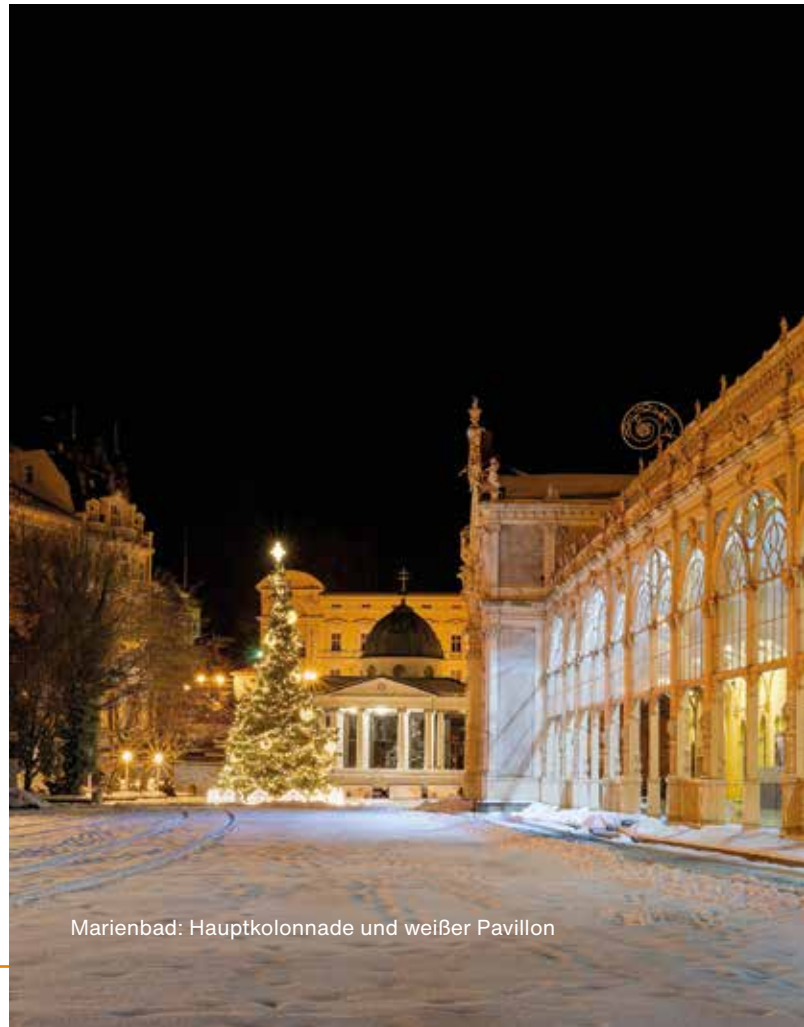
Marienbad: Hauptkolonnade und weißer Pavillon

Die Kosten stehen erst mit dem detaillierten Programm fest.