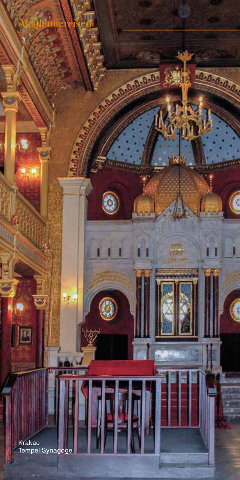
Krakau Tempel Synagoge