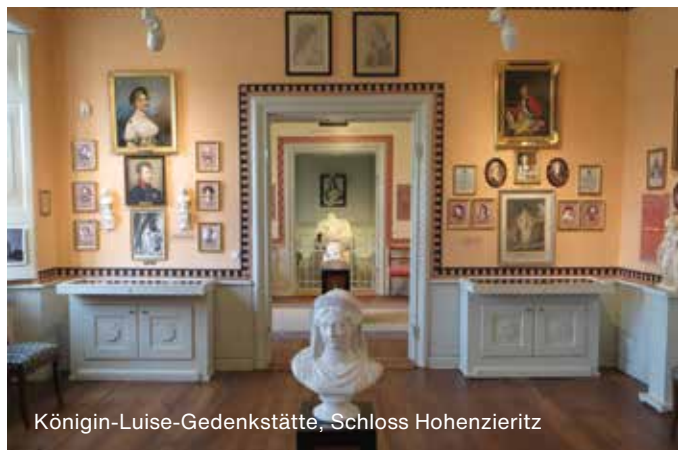
Königin-Luise-Gedenkstätt, Schloss Hohenzieritz

Die Kosten stehen erst mit dem detaillierten Programm fest.