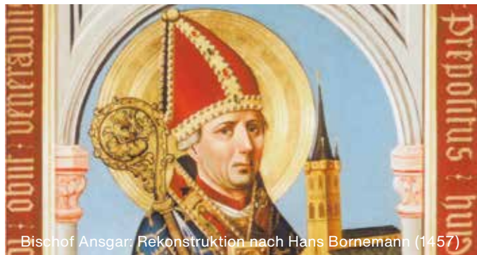
Bischof Ansgar: Rekonstruktion nach Hans Bornemann (1457)