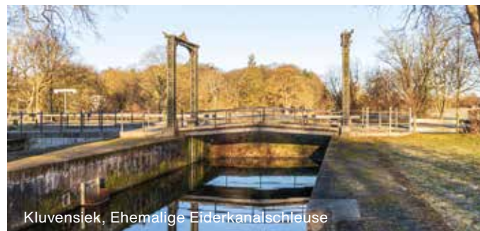
Kluvensiek, Ehemalige Eiderkanalschleuse