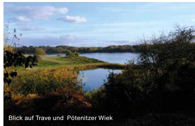
Blick auf Trave und Pötenitzer Wiek