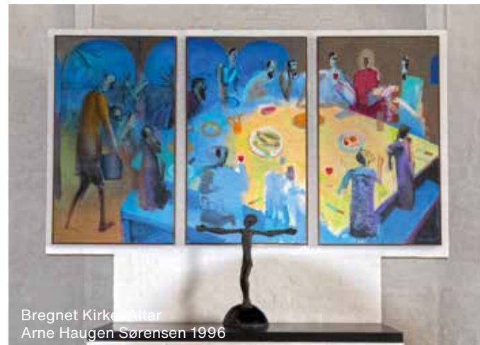
Bregnet Kirke Altar Arne Haugen Sørensen 1996