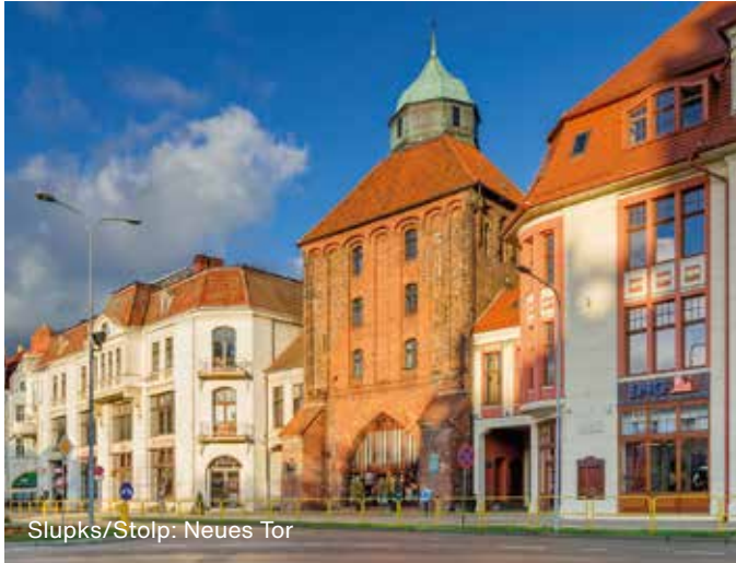
Słupsk/Stolp: Neues Tor