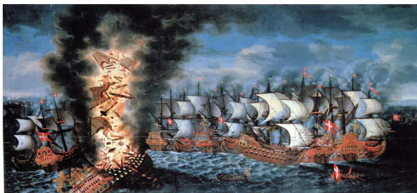
Kronan (Schiff, 1672) in der Seeschlacht bei Öland

Abendessen und Übernachtung im zentral am Hafen gelegenen Hotel Packhuset in Kalmar.