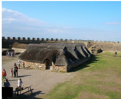
Burg Eketorp, Innenhof