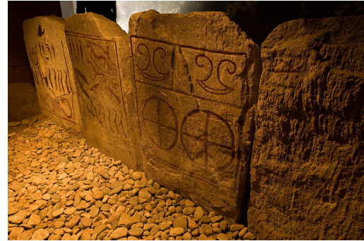
Grab von Kivik