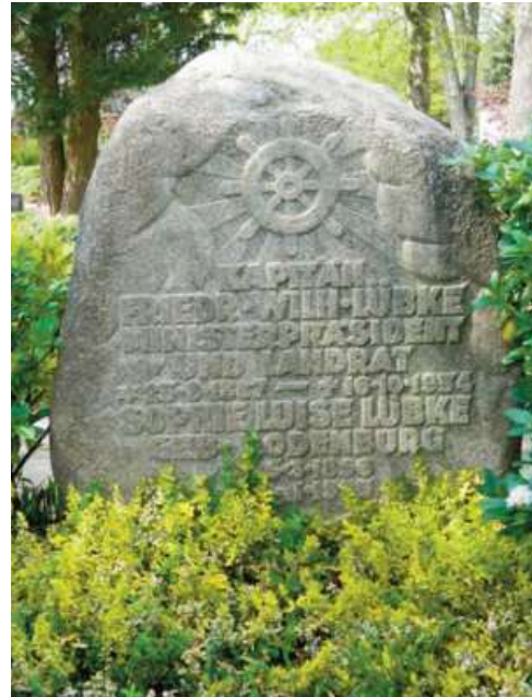
Abb. 8: Grabstein auf dem Friedhof in Oeversee

Aus Sicht des Autors spiegeln die vielen von F. W. Lübke in kurzer Zeit initiierten Projekte das erfolgreiche Engagement für die Zukunft des Landes Schleswig-Holstein wider. Als ein noch größerer Verdienst seiner Regierungszeit ist sicherlich zu werten, dass es F. W. Lübke gelungen war, in kurzer Zeit die Demokratie im turbulenten Nachkriegs-Schleswig-Holstein zu festigen und ein versöhnliches Verhältnis zum Nachbarland Dänemark zu entwickeln. Vielleicht war er damit ein früher Mitimpulsgeber für unsere heutige EU. Vielleicht waren seine zielorientierten Fähigkeiten als Kapitän, gepaart mit Erfahrungen und Kontakten auf allen Kontinenten und seine Bodenständigkeit als Landwirt mit dem Wissen für praktische, umsetzbare Lösungen gute Eigenschaften für Regierungshandeln in schwerer wirtschaftlicher und politischer Zeit.