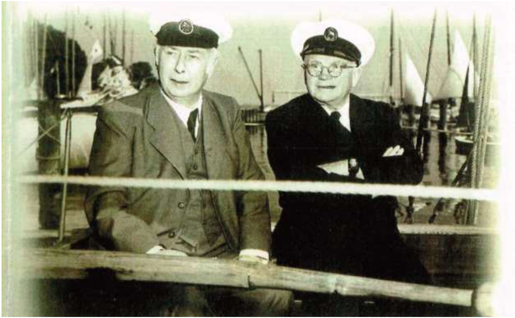
Abb. 6: Lübke und Heuss auf der Kieler Woche

hatte der Rückgang der Arbeitslosigkeit binnen drei Jahren von 24 auf 12 Prozent. Es war aus Sicht des Autors ein Glücksfall für Schleswig-Holstein, dass F. W. Lübke mit Fähigkeiten und Kompetenzen, gewonnen aus landwirtschaftlicher Bodenständigkeit, Welterfahrung und Führungskompetenz eines Kapitäns in schwieriger Zeit politische Führung übernehmen musste. Für F. W. Lübke hatte die Pflicht und die Verantwortung für das Land oberste Priorität. Am 5. 8.1951, wenige Wochen nach seiner Wahl, formulierte er seine Aufgabe in einem Vortrag auf dem Scheersberg folgendermaßen: Die letzten Wochen ließen keine Zeit für Repräsentation. Meine Mitarbeiter und ich hatten in erster Linie dafür zu sorgen, dass weiterhin eine geordnete Verwaltung sichergestellt wurde. Es ist Ihnen sicher nicht unbekannt geblieben, unter welchen Verhältnissen und Bedingungen ich die Regierung übernommen habe, und da hieß es erst für Brot zu sorgen, denn die Kassen waren leer.