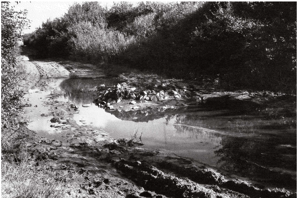
Abb. 5: Unbefestigter Feldweg auf der Geest 1953

Der Start der „Programm-Nord“-Förderung lief im gleichen Jahr 1953 auf Hochtouren an. Die ersten Baumaßnahmen für den Gewässerausbau, für Wegebau und Flurberei-