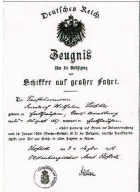
Abb.2: Patent für die Große Fahrt