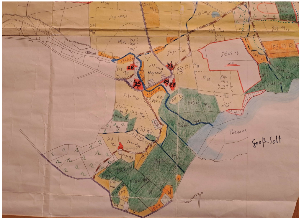
Abb. 3: Bodenkarte von Augaard