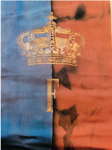
Abb. 7: Trauergebilde von König Frederik IX von Dänemark für F. W. Lübke

der Landesregierung vom 8.10.1957 wurde der von F. W. Lübke entwickelte 1200 ha große Koog als neue Kommune ausgewiesen und die Gemeinde Friedrich-Wilhelm-Lübke-Koog gegründet. Mit der Namensgebung würdigte die Landesregierung die Verdienste von F. W. Lübke.