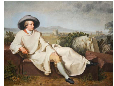
Johann Heinrich Wilhelm Tischbein: Goethe in der Campagna, Gemälde von 1787