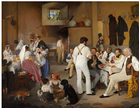
Ditlev Blunck: Künstler (Bertel Thorvaldsen) in einer römischen Osteria, Gemälde von 1836