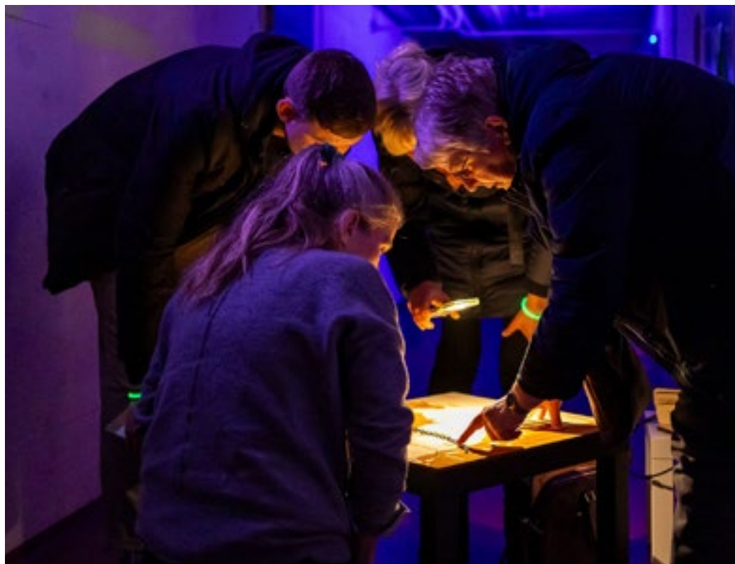
Er man glad for at knække koder og lære nye ting om mindretallene, er den nyåbnede labyrint et besøg værd.

Mindretalslabyrinten var oprindeligt tiltænkt Akademiets besøgende, men på grund af den store interesse har man valgt at åbne den for offentligheden. Vil man vide mere, kan man kontakte Akademiezentrum Sankelmark.