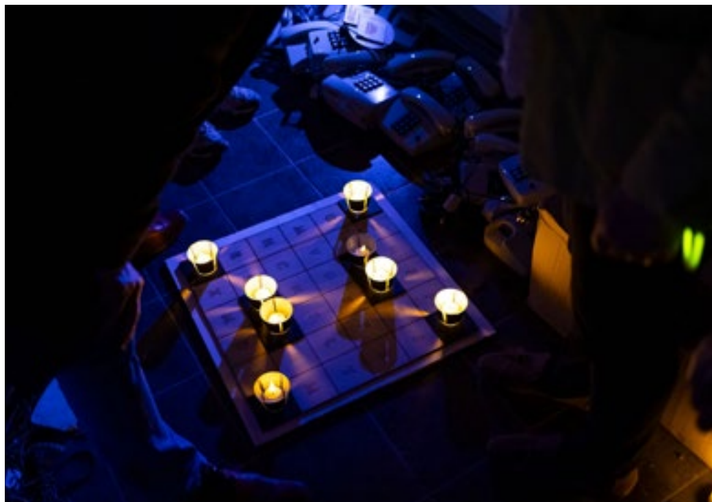
På en spilleplade med bogstaver skal lysene placeres korrekt, så løsningsordet træder frem.